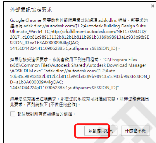
Chrome出現的訊息，請選擇「啟動應用程式」